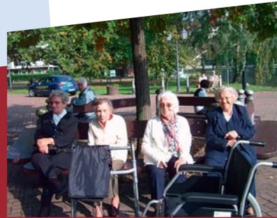
Fahrt mit der Saalefee gemeinsam mit den Bewohnern des Pflegezentrums „Am Klinikum“

Für längere Wege – beispielsweise zum Arzt oder zu Klinikaufenthalten – kann von den Bewohnern auch der Fahrdienst in Anspruch genommen werden.