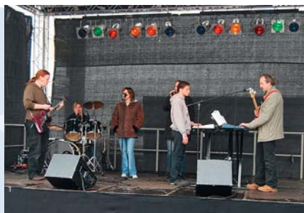
unsere Band „Anton“