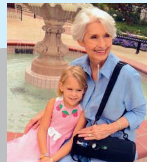
Sauerstoffgeräte sind für Betroffene im Alltag unentbehrlich

Klinz: Konkret bedeutet das, dass der Kunde einige auf Rezept verschriebene Hilfsmittel nicht mehr bei mir erhalten kann, weil ich mit Krankenkassen keinen entsprechenden Liefervertrag habe. Sauerstoffgeräte, aber auch Gehhilfen sind dafür Beispiele. Somit kann ein Patient seine auf Rezept verschriebenen Gehhilfen von einer Firma erhalten, die nicht vor Ort ist. Somit verlängern sich die Anfahrts- bzw. Lieferwege und dadurch verlängern sich die Wartezeiten auf das Hilfsmittel für die Patienten. Es kann passieren, dass ein Patient von mehreren Sanitätshäusern mit jeweils verschiedenen Hilfsmitteln versorgt wird. Ich habe natürlich Gehhilfen und andere Hilfsmittel, die bei uns jederzeit käuflich erworben werden können.