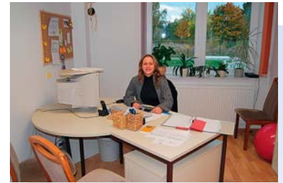
Unsere zuständigen Mitarbeiter beraten Sie gern.

Die Angebote des Familienentlastenden Dienst sind in Art und Umfang auf die individuellen Erfordernisse in den Familien abgestimmt. Die Familien entscheiden weitgehend selbst über Helfer, Ort, Art und Umfang der Hilfen. Die sozialpädagogischen Betreuungs- und Pflegehilfen können stundenweise, tageweise oder mehrtätig in der Wohnung der Familien oder in den Betreuungsräumen des Familienentlastenden Dienstes der Lebenshilfe Bernburg gGmbH verrichtet werden.