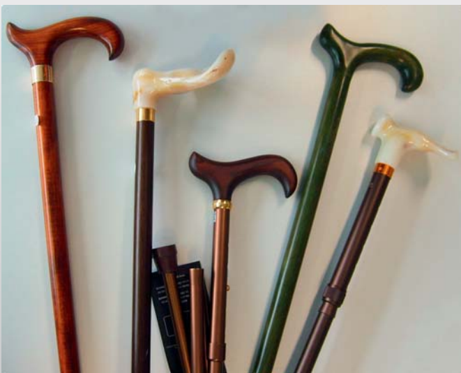
Auf bestimmte Hilfsmittel, wie Gehhilfen, müssen Kunden unnötig lange warten.

kenkasse sie für ihr Geld die meisten Leistungen erhalten. Ich plädiere für mehr Eigeninitiative. Man sollte sich eine Kasse mit Ansprechpartner vor Ort suchen. Darüber was eine Krankenkasse im konkreten Krankheitsfall leistet, kann sich jeder auch bei den Leistungserbringern vor Ort, wie z. B. Apotheker, Zahn-techniker, Optiker, Sanitätshäuser etc. erkundigen. Es gibt schon einige Ermessensspielräume bei der Bewilligung von Hilfsmitteln.