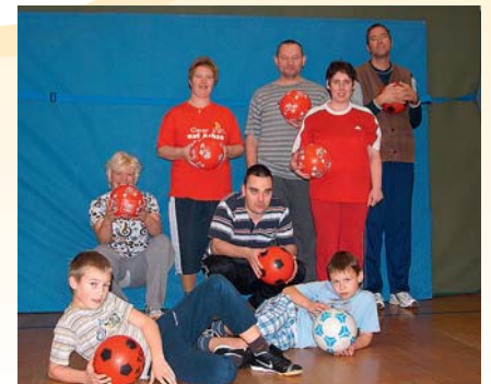
Sport, Spiel und Spaß für jeden!