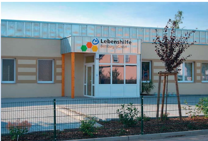
In der Paldamusstraße befindet sich der FeD und die Frühförderung und Beratungsstelle der Lebenshilfe Bernburg gGmbH

Wenn Ihr Kind in eine Pflegestufe eingestuft wurde, erhalten Sie finanzielle Unterstützung im Rahmen der Pflegeversicherung. Erhält Ihr Kind keine Leistungen aus der Pflegeversicherung, kann das zuständige Sozialamt Leistungen des Familienentlastenden Dienstes im Rahmen von Hilfe zur Pflege bewilligen.