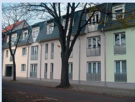
Wohnanlage „Neue Straße“