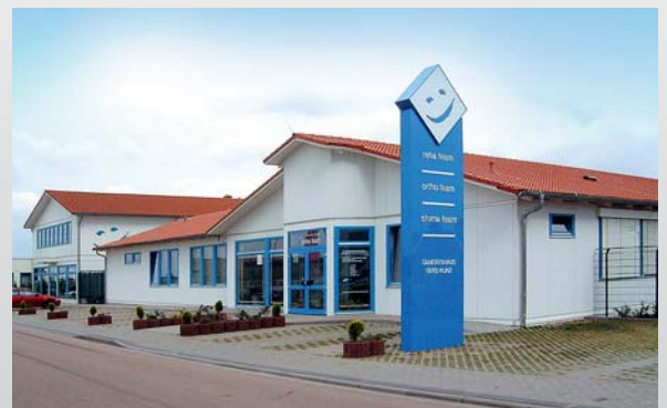
Das Sanitätshaus Klinz finden sie in Bernburg in der Ernest-Solvay-Str. und im Stadtzentrum in der Lindenstraße.

Natürlich kann jeder Patient frei entscheiden, wo er sein Rezept einlösen will. Er kann jederzeit eines unserer Geschäfte besuchen und wir werden ihm behilflich sein und ihn beraten, auch wenn wir nicht immer der Lieferant des Hilfsmittels sind.